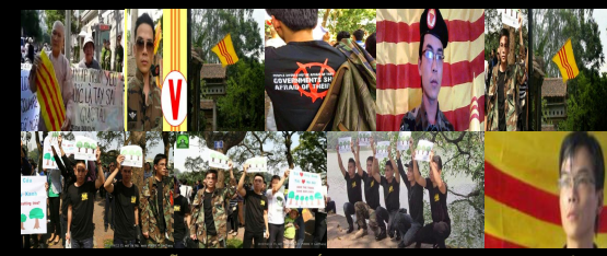
Kỷ Niệm Ngày Lễ 30 Tháng 4, Bắc-Trung-Nam (Hà Nội, Huế, Sài Gòn) chung một màu Cờ Vàng Ba Sọc Đỏ. Quốc Gia Việt Nam Cộng Hòa đã có trong lòng người dân yêu chuộng Cộng Hòa!