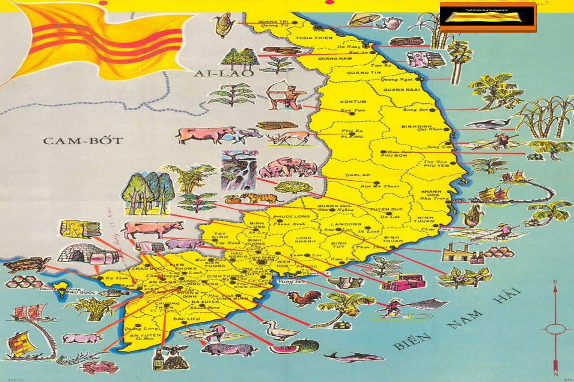
Creative frame & poem: Lâm-Ngọc-Mai-Hồng-Jacquiline. Date: 4/30/2015. Ất Mùi. Kỷ Niệm Ngày Lễ 30/4/1975