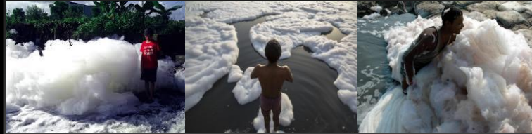
Từ nhà máy nước thải bọt xà phòng ra ... vì Dân ...

2. Cùng ngày vào đêm tối, người dân tỉnh Bình Thuận nổi lửa chặn quốc lộ 1A, ném bom xăng chống trả Công An (CA) đàn áp! CA dùng lựu đạn cay, súng bắn vào dân!