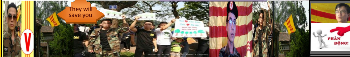
Creative frame & poem: Lâm-Ngọc-Mai-Hồng-Jacquiline. Date: 4/30/2015. Ất Mùi. Kỷ Niệm Lễ 30/4/1975